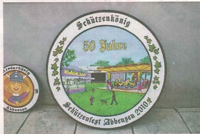
Auf der Jubiläumsscheibe zum 50. Schützenfest ist eine kunterbunte Jahrmarkt-Szene zu sehen. hh

Vor 16 Jahren hat die Autodidaktin mit dem Malen begonnen, vor vier Jahren machte sie es zu ihrem Hauptberuf. Damit habe sie lange gezögert, sagt sie. „Meine Eltern haben gesagt: Mädchen, davon kannst du nicht leben. Und ich bin eigentlich sehr bodenständig.“ Heute gibt sie Malunterricht, zeichnet Porträts, stellt Bilder aus – und ist stolz, wenn sie „ihre“ Scheiben im Dorf entdeckt. sur